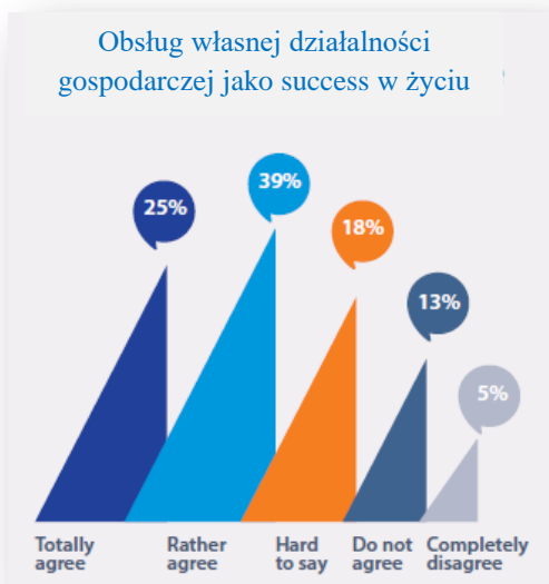
Rys. 2. Osiągnięcia jako motywacja do przedsiębiorczości kobiet w Ukrainie. Wyniki badań „Przeszkody w przedsiębiorczości wśród kobiet w Ukrainie (2015)”, Badacz główny: dr John Johnson

Innym ciekawym faktem, na który warto zwrócić uwagę, jest to, że większość ukraińskich kobiet przedsiębiorców rozpoczęła swoją działalność nie przez naturalną ambicję i pragnienia do osiągnięcia czegoś więcej, ale ze względu na ciężką rzeczywistość życiową (Rys. 2).