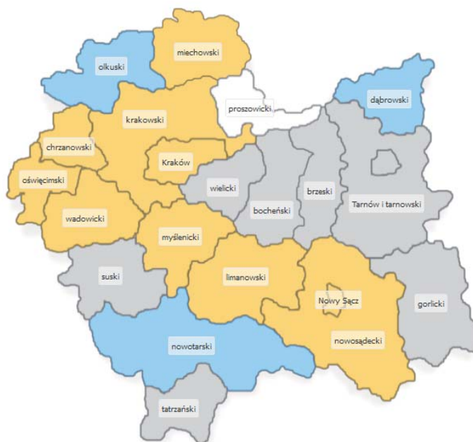
Mapa 1. Prognozowane zapotrzebowanie na pielęgniarki w powiatach Małopolski w 2015 r.

Legenda: niebieski – nadwyżka; szary – równowaga; pomarańczowy – deficyt, biały – brak prognozy.