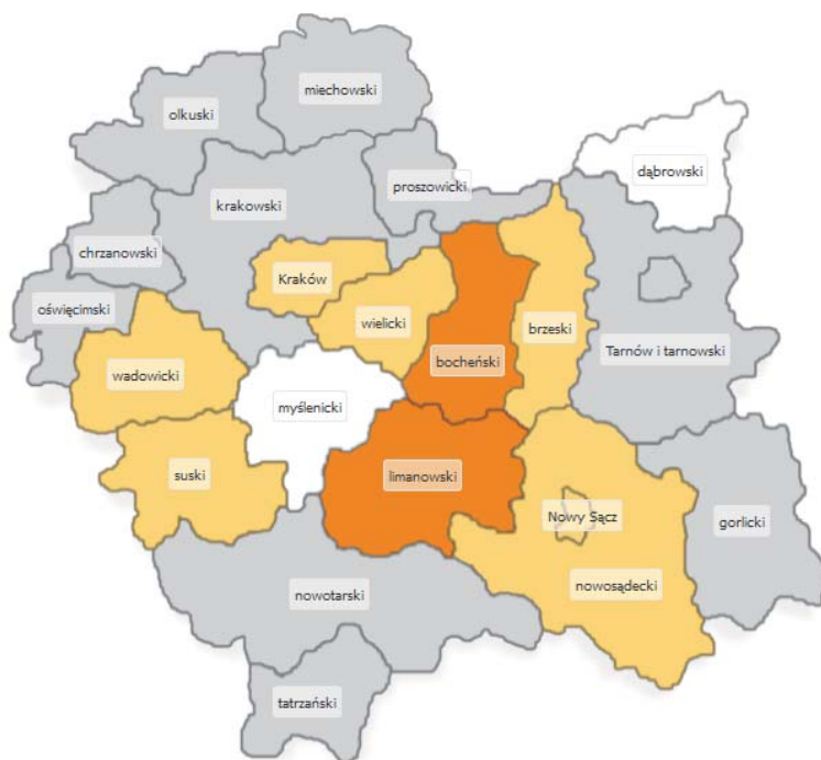
Mapa 1. Prognozowane zapotrzebowanie na diagnostów samochodowych w powiatach Małopolski w 2015 r.

Legenda: szary – równowaga; ciemny pomarańczowy – duży deficyt; pomarańczowy – deficyt, biały – brak prognozy.