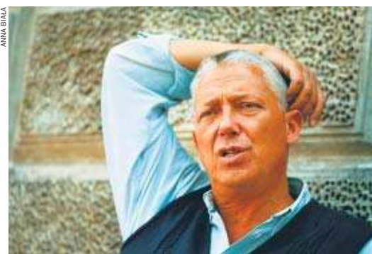
... zaśpiewania piosenek Wojciecha Młynarskiego

kiem dobrze, choć z pewnością znajduje się niejedyn fan, któremu „Tak jak malował pan Chagall” wyda się zbyt melodyjny, a „Jesteśmy na wczasach” - zbyt poważne. Muzyczna droga obrana przez lidera zielonogórskiej grupy, choć z pozoru raczej klasyczna, kompletnie zmienia ascetyczne, melorecytowane, zazwyczaj wyłącznie przy akompaniowaniu fortepianu, piosenki Młynarskiego. Bunt słuchacza rozmiłowanego w pierwowzorznie jest więc niczym dziwnym, zwłaszcza jeśli interpretację Raz Dwa Trzy poznaje z płyty CD. Najpierw przeko-